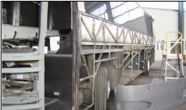
Plastikowe panele i listwy z plastiku używane do obudowy autowy autobusów.