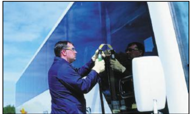
Użycie wycinarki BTB znacznie skraca czas demontażu szyb autobusowych