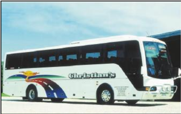
Szyby autobusowe oraz panele z tworzyw montowane są za pomocą kleju uretanowego